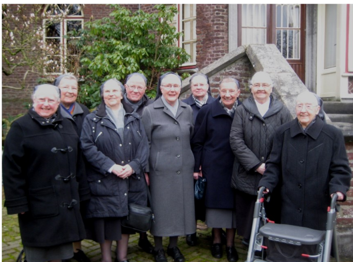
Foto: Zusters Goddelijke Voorzienigheid in Aerwinkel