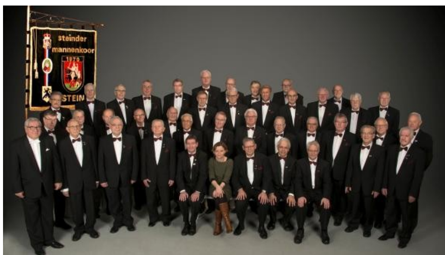
De muzikanten van het najaarsconcert op zondag 18 september a.s.

De kerk is rolstoelvriendelijk en beschikt over (invaliden-) toiletten.