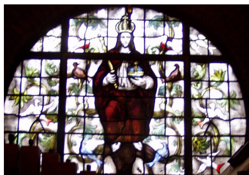
Een foto van een glas-in-lood raam uit de Kapel van het Franse Klooster, waarin Christus te zien is tussen ranken en vogels..

Om de toekomst van de ramen in veiligheid te stellen met betrekking tot de ontwikkelingen van het klooster is het stichtingsbestuur in gesprek met een glazenier en deskundigen hieromtrent. Er zal een visie ontwikkeld worden aangaande de huidige staat, het behoud en het herbestemmingsperspectief van deze ramen. Wij zullen met de nieuwe eigenaar van het complex, hopelijk binnenkort, overleggen wat zijn plannen zijn met de ramen.