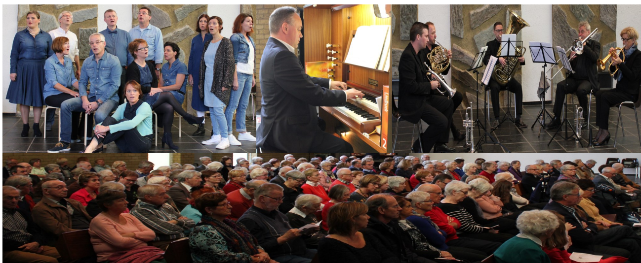
Een foto-compilatie van de musici en de volle kerk tijdens het najaarsconcert op 18 oktober jl.

Tijdens het najaarsconcert kon iedereen genieten van koorzang, kopermuziek en orgelspel. De opkomst van het publiek was overweldigend!