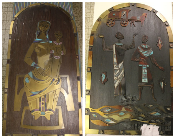
Een foto van de beschadigde iconen uit de Kapel van het Franse Klooster. De iconen worden momenteel gerestaureerd.

De iconen hebben een aantal jaren geleden vocht- en brandschade opgelopen in de kapel. De stichting heeft destijds de iconen gedemonteerd en veilig opgeslagen. En nu worden ze gerestaureerd! De metaalopslag wordt zorgvuldig door onze vrijwilligers gereinigd en geplaatst op twee splinternieuwe houten panelen. De iconen zullen binnen korte termijn een herbestemming krijgen op een passende plek. De stichting is hierover in gesprek met verschillende partijen. Meer informatie volgt.