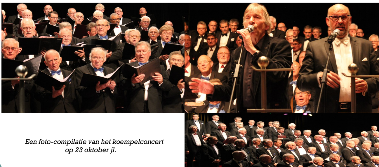
Een foto-compilatie van het koempelconcert op 23 oktober jl.

Het stichtingsbestuur is het DSM Sabic koor erkentelijk voor deze bijzondere geste!