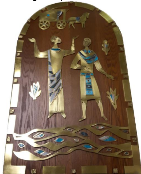
na de restauratie