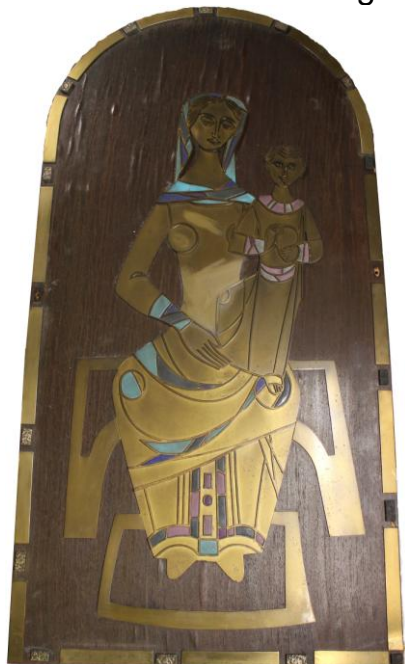
voor de restauratie