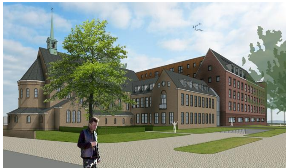
Een illustratie uit het voorontwerp bestemmingsplan Franse Klooster.

Bestuur Stichting Behoud Franse Klooster