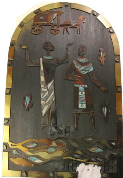
voor de restauratie