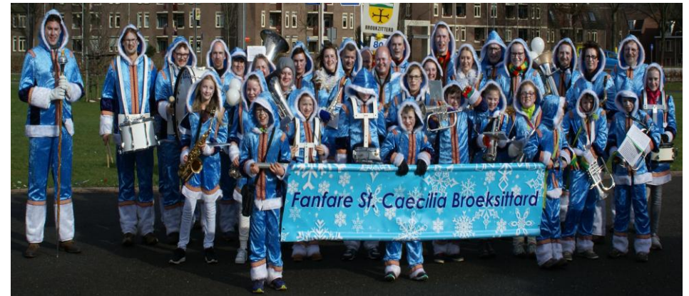
Fanfare St. Caecilia uit Broeksittard voor de carnavalsoptocht in Sittard

Ons repetitielokaal vindt u in het Gemeenschapshuis aan de Dorpstraat 1 te Broeksittard.