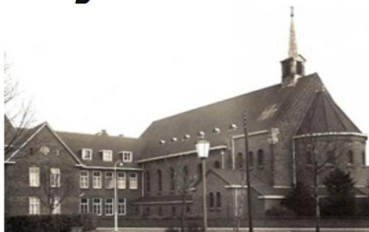
Stichting Behoud Franse Klooster