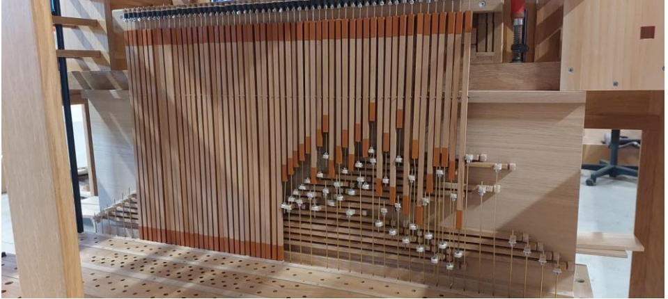
De mechaniek van het orgel (mechanische tractuur).

Bijgaande foto's van de bouw van het continuo-orgel van de afgelopen periode. Op deze foto's kunt u duidelijk zien dat de bouw van een mechanisch pijporgel een echt 'ambachtswerk' is. De mechaniek (tractuur) van het orgel gaat geheel met touwtjes en latjes. Alle pijpwerk in het orgel is afkomstig van het Verschuieren-orgel uit de Kapel van het Franse Klooster.