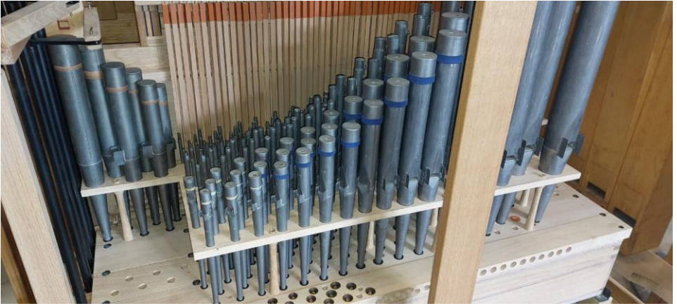
Achteraanzicht van het pijpwerk in het orgel.