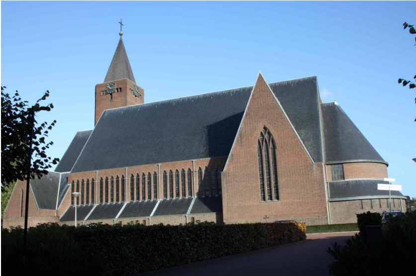
Heilig Hartkerk in Overhoven-Sittard.