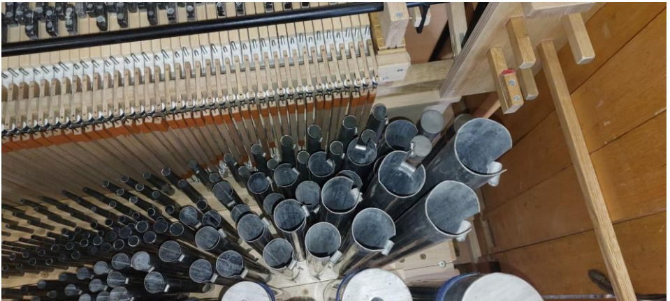
Bovenaanzicht van het pijpwerk in het orgel.