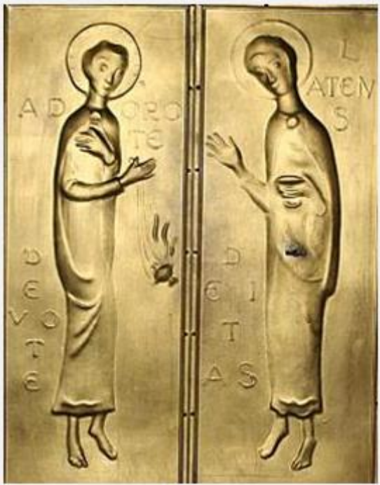
De twee deuren van het tabernakel, afkomstig uit de kapel van het Franse Klooster. Hierop staat de tekst: “Adoro te devote, latens Deitas”, vertaald: “Ik aanbid U met eerbied, verborgen God”.

In de Kapel van het Franse Klooster zaten op de deurtjes van het tabernakel (rechts voor op het priesterkoor) twee afbeeldingen van engelen. Hierop staat de tekst: “ Adoro te devote, latens Deitas ”, vertaald: “ Ik aanbid U met eerbied, verborgen God ”.