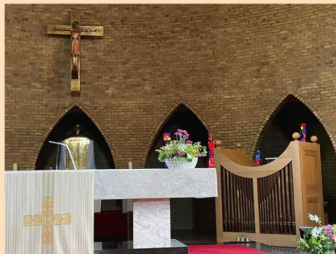
STICHTING BEHOUD FRANSE KLOOSTER

De nieuwbouw van het continuo-orgel door Nijssse Orgelbouw met gebruikmaking van het pijpwerk uit het Verschuieren pijporgel uit de voormalige ziekenhuiskapel (Franse Klooster) Sittard.