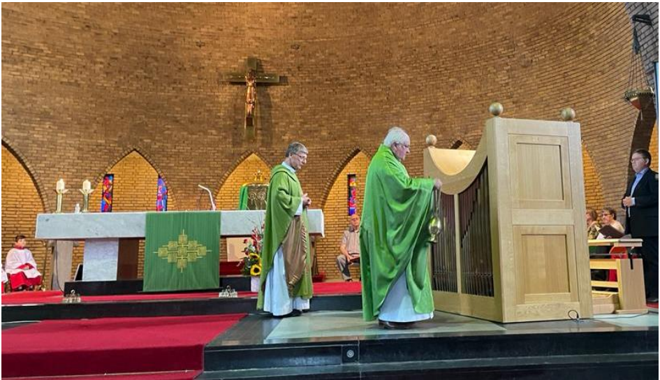
Foto van de inwijding van het orgel tijdens de Eucharistieviering